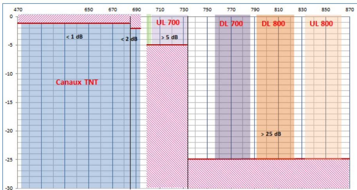
Gabarit du filtre 700–800 MHz

Les spécifications, le détail et les éléments associés sont consultables sur le site internet de l'ANFR www.anfr.fr